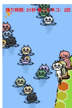
▲おまけミニゲーム